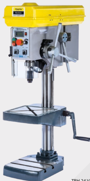
TBH 24 VARIO

Com monitor digital e regulação de velocidade 4 velocidades