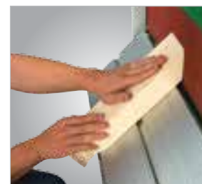
Lixa em esquadria até 45° na mesa longitudinal