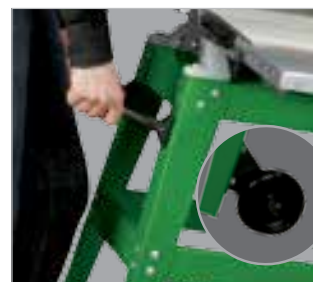
Chassi prático para o transporte e mudança do equipamento