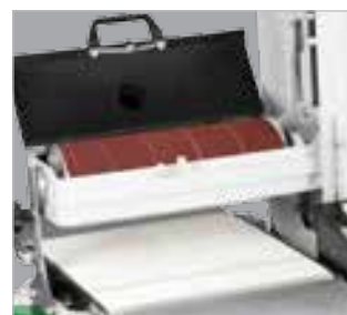
Mudança da cinta mais fácil e mais rápida