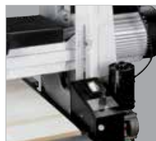
Ajuste da altura da unidade de lixa controlado pela escaleta