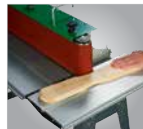
O processo de lixar raios simplificado