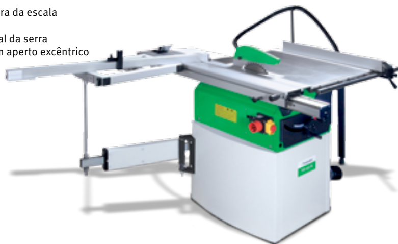
TKS 250 SC Ref. 5900256 (230V)