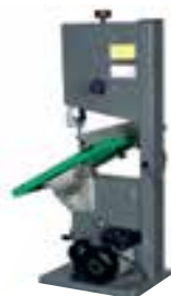
Vista traseira com a mesa inclinada