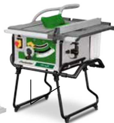
Pernas são acessório