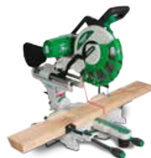
Laser guia de corte