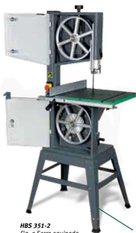
HBS 351-2 Fig. a Serra equipada com o acessórios (bancada)