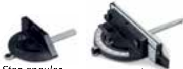
Stop angular HBS 251 Ref. 5910810