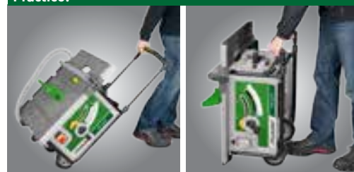
Fácil de transportar