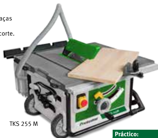
TKS 255 M