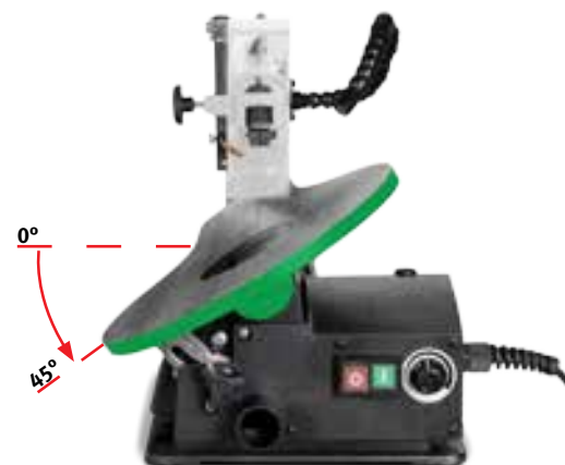
Mesa inclinável de -45° a 0°