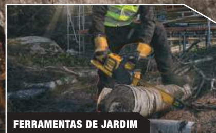
FERRAMENTAS DE JARDIM