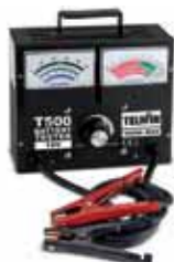
APARELHO TESTE BATERIAS T500