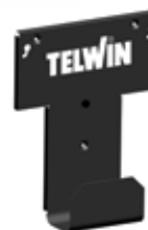
SUPORTE DE PAREDE S