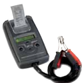
APARELHO TESTE BATERIAS DTP 800