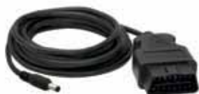
SALVA MEMÓRIAS OBD II