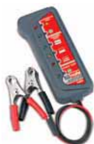
TESTE BATERIAS/ ALTERNAD. BTS 350