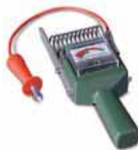
APARELHO TESTE BATERIAS T200