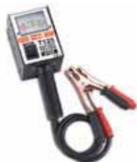
APARELHO TESTE BATERIAS T125