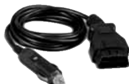
SALVA MEMÓRIAS OBD II