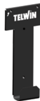
SUPORTE DE PAREDE L