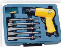
H-12K / H