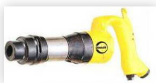
CH-101 / 104H