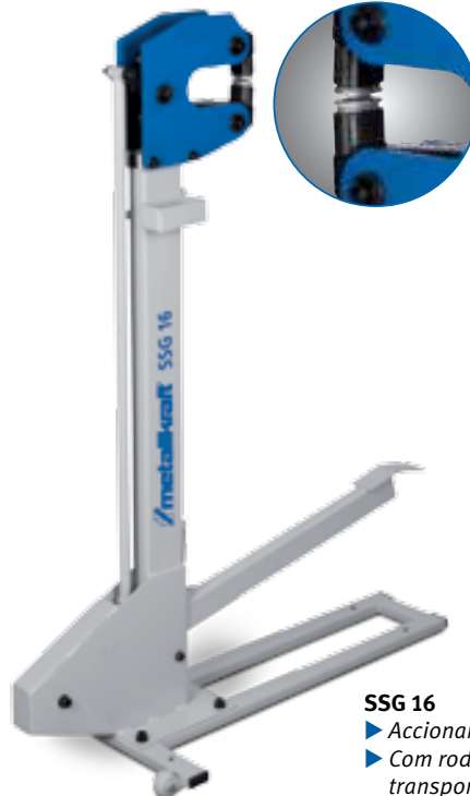
SSG 16 ▶ Accionamento por pedal ▶ Com rodízios para facilitar o transporte