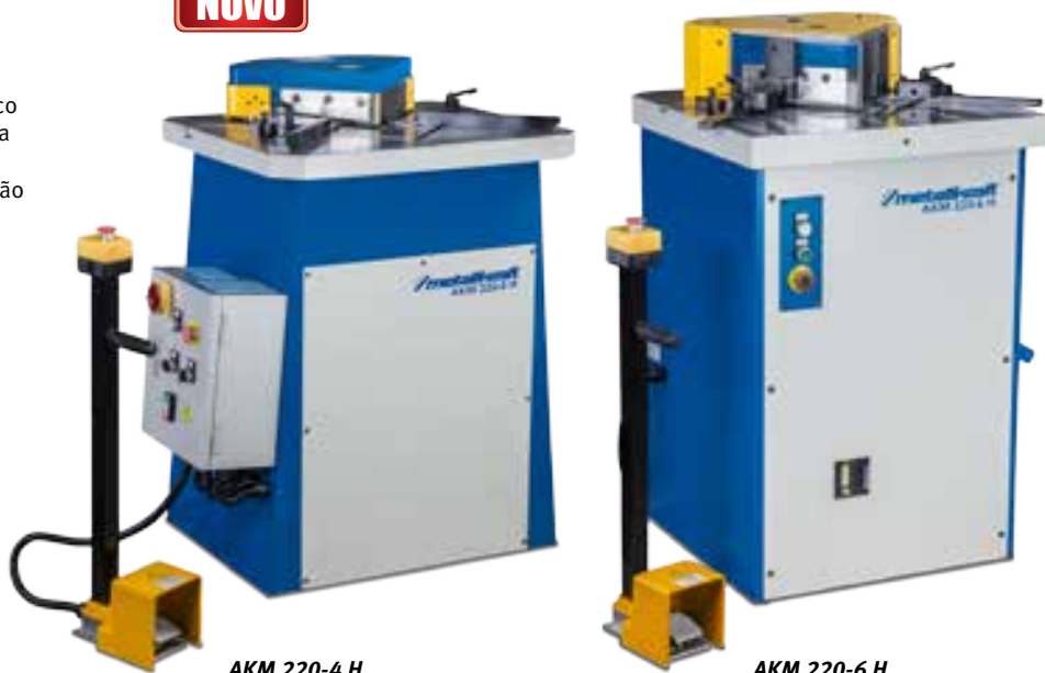
AKM 220-4 H