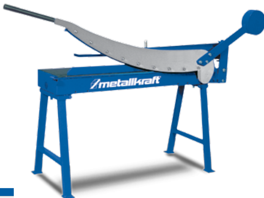
BSS 1000 Ref. 3741100