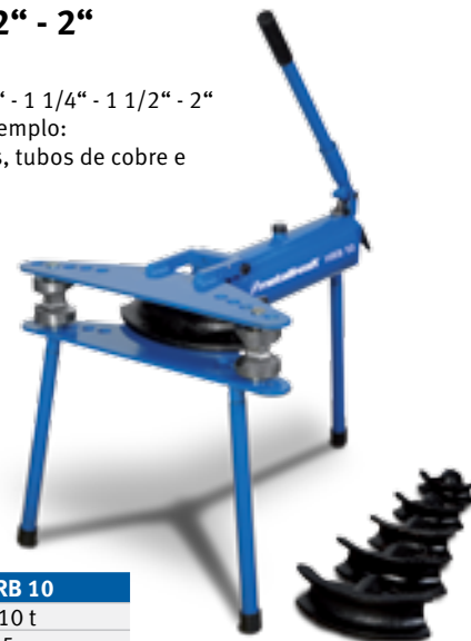
HRB 10 Ref. 3777010