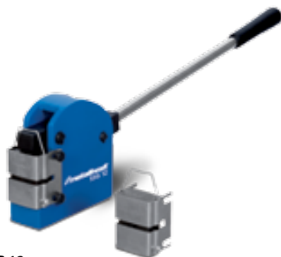
SSG 12 ▶ Accionamento por alavanca ▶ Representação do equipamento standard