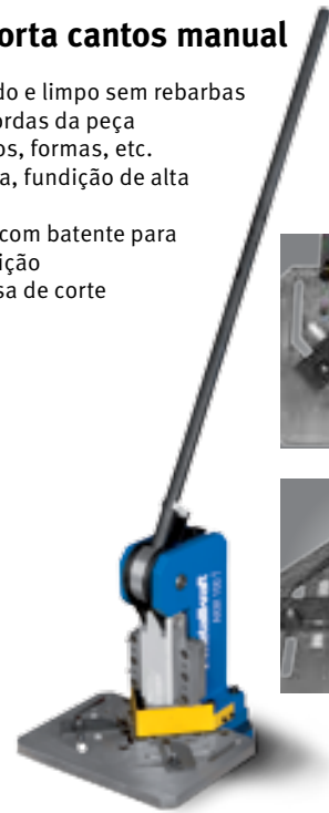
AKM 100 T Ref. 3770512