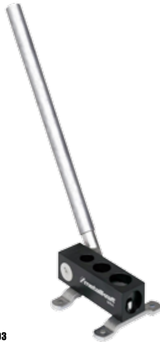
MRA 2 Ref. 3772992