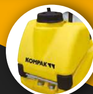
TANQUE DE AGUA