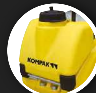
TANQUE DE AGUA